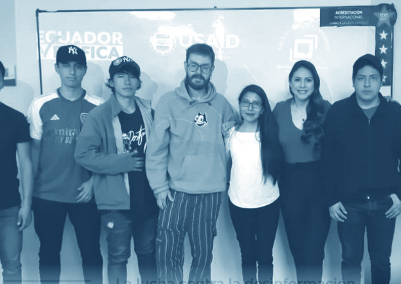
La lucha contra la desinformación

Los talleres que se han brindado están enfocados en presentar qué es la desinformación, cómo combatirla, por qué es tan peligrosa y qué tan vulnerables están los ciudadanos frente a estas prácticas. En estos talleres, como proceso de aprendizaje, también se incluyen ejemplos de verificaciones realizadas por Ecuador Chequea y se explica la metodología que utiliza el medio de comunicación para verificar contenidos. Además, se presentan un listado de herramientas en línea que ayudan a identificar si una imagen ha sido editada o no y cuál es el contexto de la fotografía que se está compartiendo en internet.